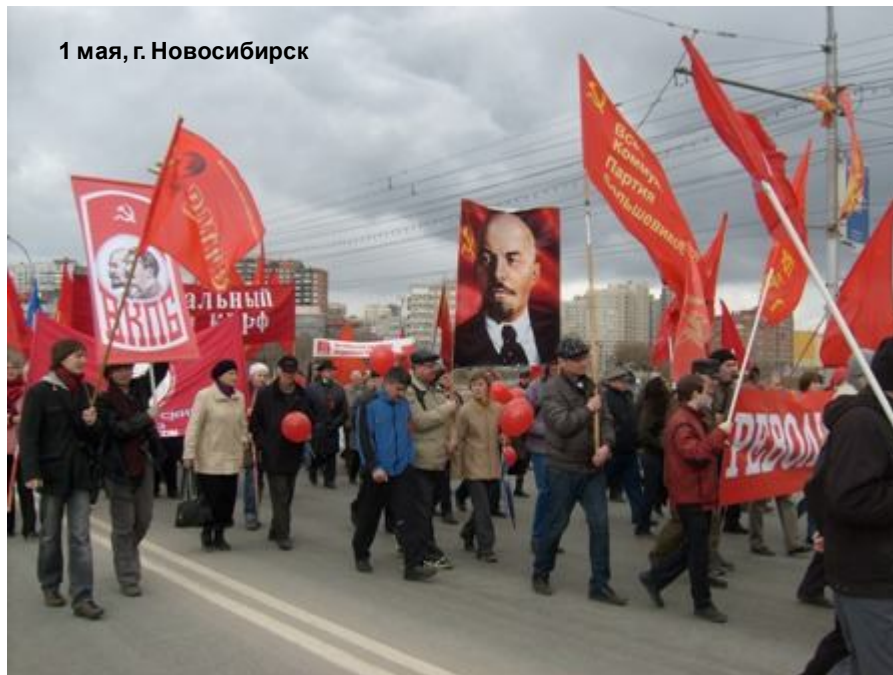
1 мая, г. Новосибирск

По линии ВМГБ издаются две газеты: центральная - «Революция», а также издание ВМГБ на Украине «Молодой большевик» - приложение к газете «Рабоче-крестьянская правда».