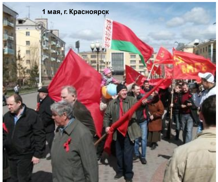
1 мая, г. Красноярск