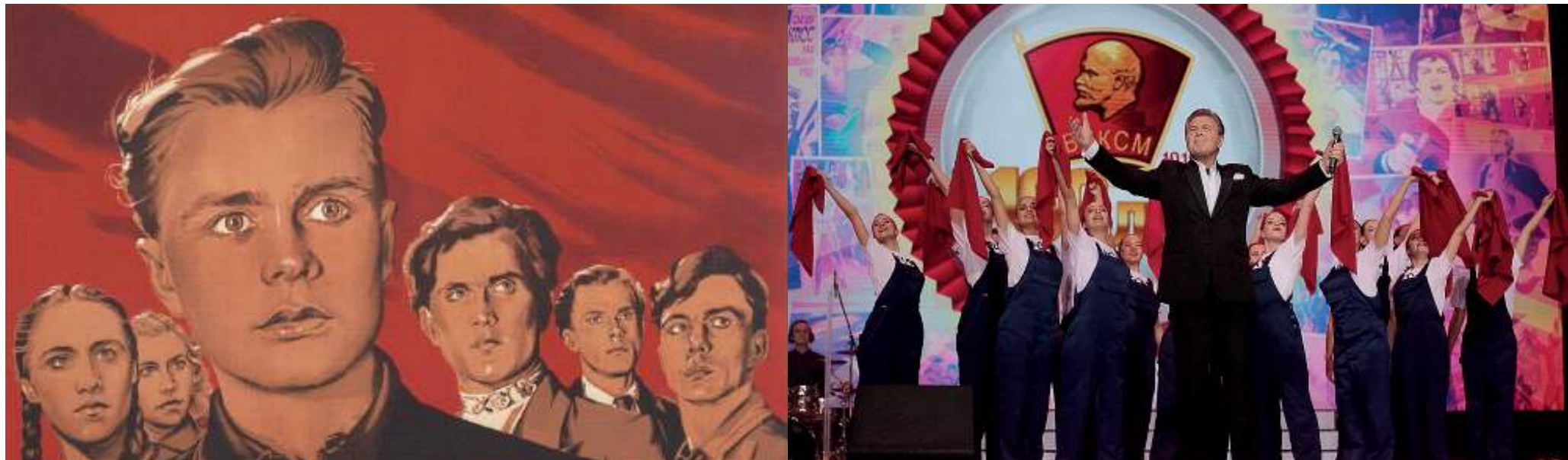
Слева — портреты героев «Молодой Гвардии» города Краснодона. Справа — концерт «100 лет ВЛКСМ». За это ли сражались и умирали наши герои?

Центральная молодёжная организация Советского Союза называлась «Всесоюзный Ленинский коммунистический союз молодёжи». На концертах, в телевизорах и в газетах нам рассказывают просто о союзе молодёжи. Поливать СССР грязью больше не модно, но и говорить о коммунизме в положительном ключе сейчас «разрешено» только разве что в передаче К. Семёна «Агитпроп». Поэтому большинство СМИ о коммунизме просто молчат, как будто его не было.