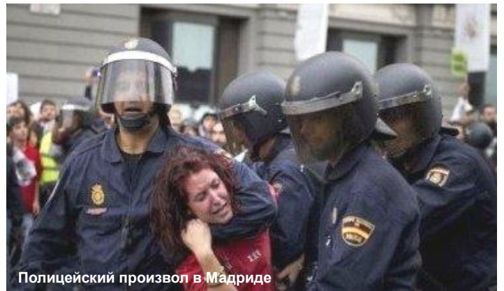
Полицейский произвол в Мадриде

Возможно, впервые классовая ненависть к глобальному капитализму сплелась с религиозной ненавистью к тому же глобализму. Ведь причина этих двух видов ненависти одна и та же – унижение, ограбление и эксплуатация стран мировой Периферии хищным, беспощадным глобальным