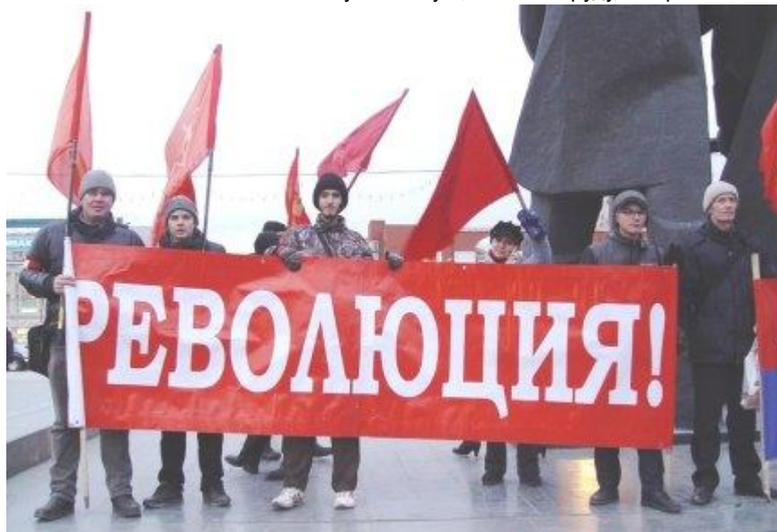
г. Новосибирск, группа активистов на митинге

Телефон для связи: 8-968-837-76-84 http://zavolu.info/3147.html