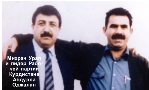
Михрач Урал и лидер Рабочей партии Курдистана Абдулла Оджалан

С 2012 года «Сирийское сопротивление / Народный фронт за освобождение Александретты (Искендеруна)», пополнившееся местными жителями, активно противостоит протурецким бандам. Лидер